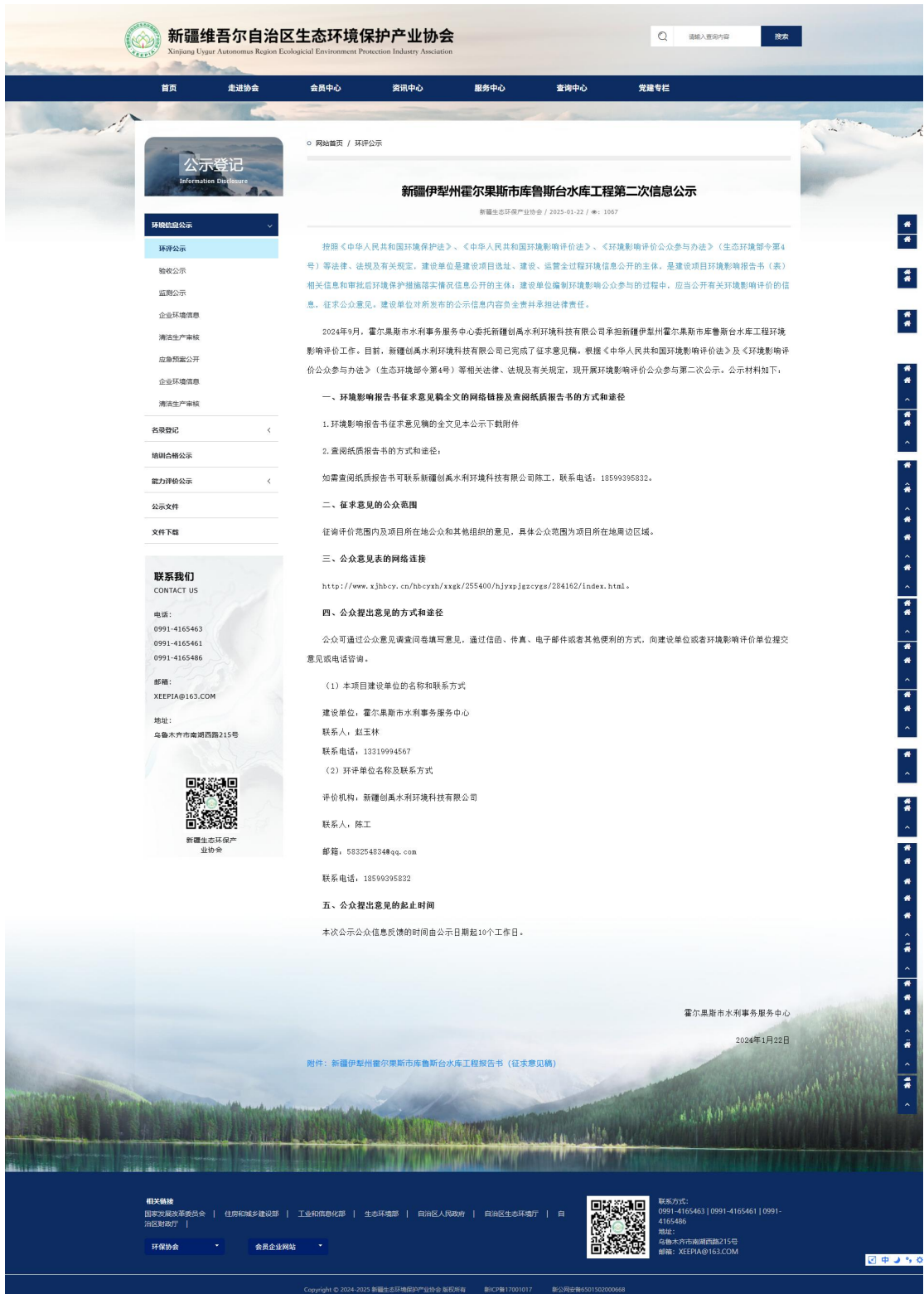
图2 第二次网络公示截图