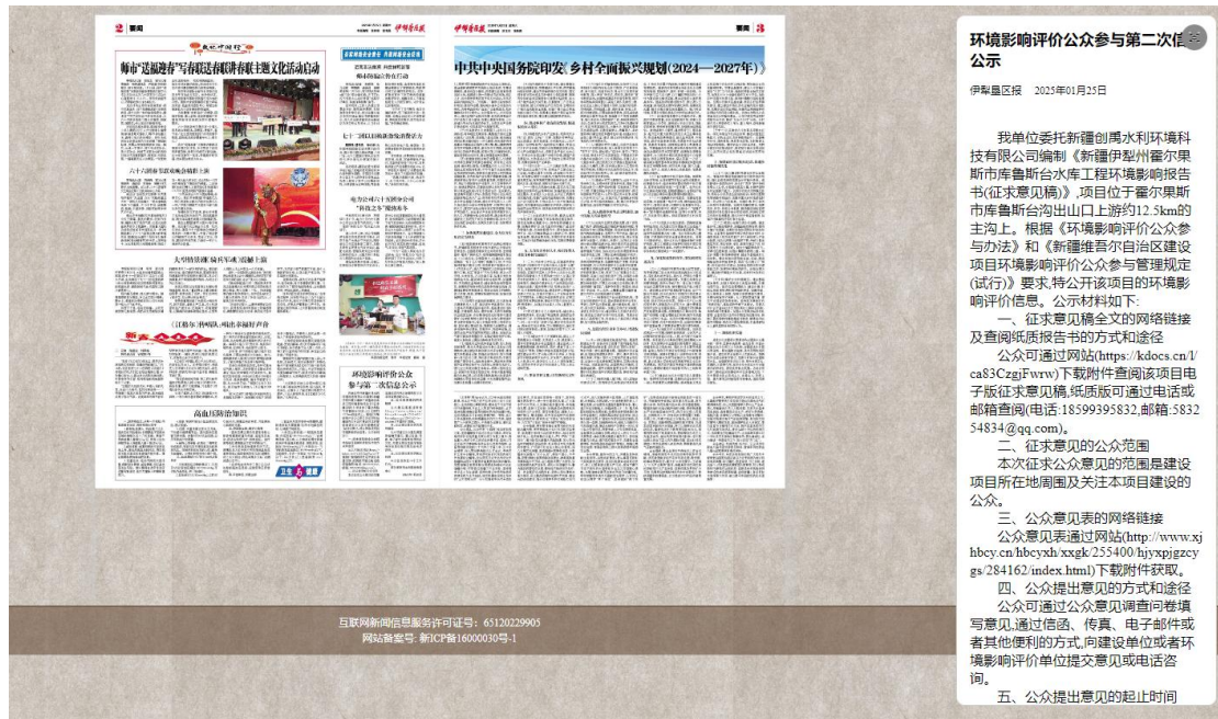
图4 2025年1月25日报纸公示