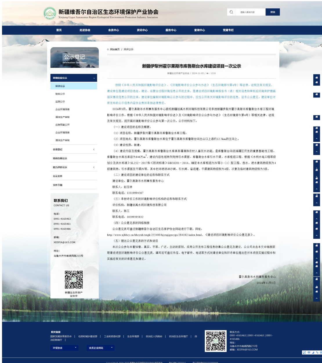
图 1 第一次网络公示截图（新疆维吾尔自治区生态环境保护产业协会网）