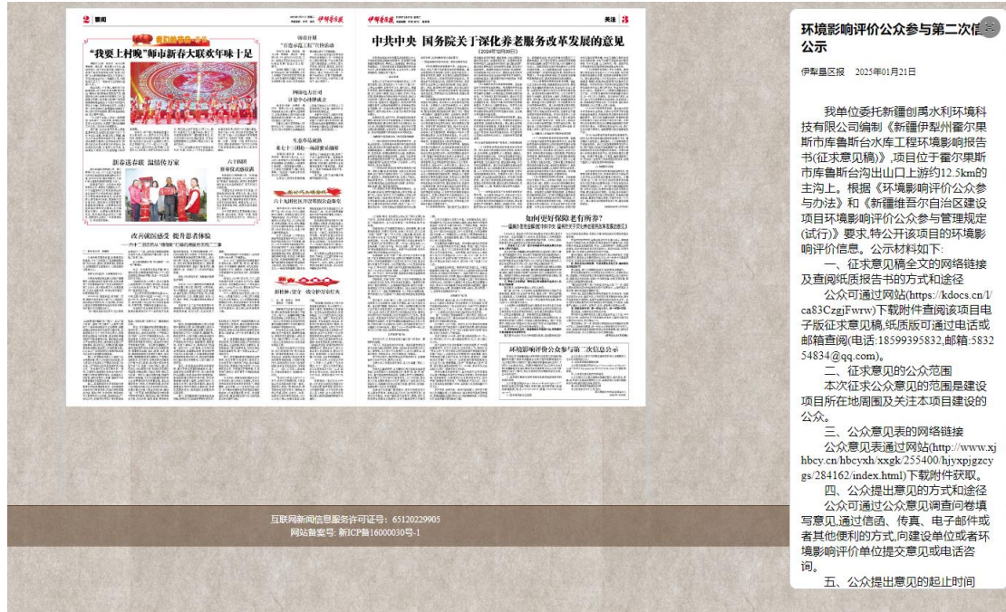
图3 2025年1月21日报纸公示

在网络公示的同时，我单位在伊犁垦区报（2025年1月21日和2025年1月25日）、发布了项目环境影响报告书公示信息，报纸公示照片件图3、图4。